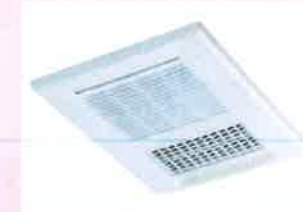
浴室暖房換気乾燥機