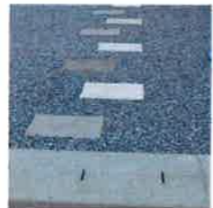
カースペース砂利工事