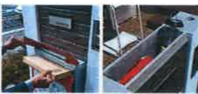
大型郵便対応ポスト「ポストロ」 防災グッズ備蓄スペース

ケイアイオリジナルの防災機能付き多機能門柱。家の入口を象徴する門柱。住まう人を守る安心・安全な機能と家族にやさしいユニークな門柱です。