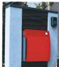
モンチューマジック