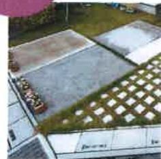
カースペース 土間コンクリート工事

カースペースの位置や芝生の設置等も事前に調整することで、バランスの良い住まいづくりが可能。庭先にウッドデッキを設けたりする事もできます。